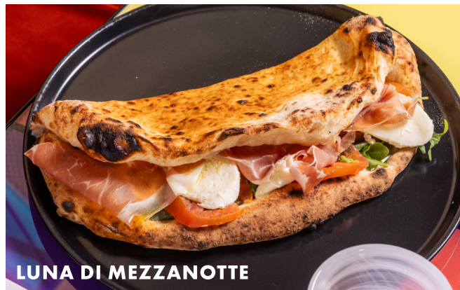
LUNA DI MEZZANOTTE